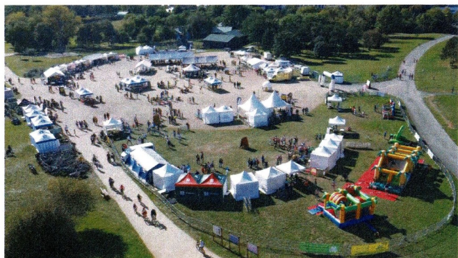
Lac de Maine - Angers